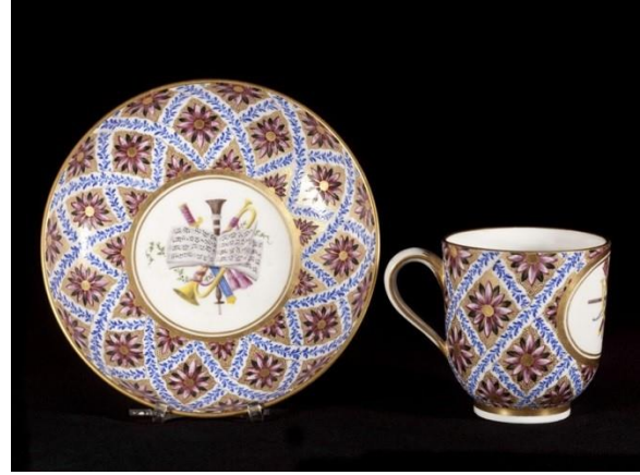
Pierre-Antoine Méreaud. Tasse calabre et soucoupe. Porcelaine tendre, 1767

D'autres dénominations sont plutôt descriptives telles le plateau carré en raison de sa forme, la tasse « litron », la tasse trembleuse et sa soucoupe ou encore le pot à lait tripode. De forme parfaitement cylindrique, la tasse « litron » créée par l'orfèvre Jean-Claude Duplessis est aujourd'hui encore très répandue et la collection d'Ernest Cognacq en offre de nombreux spécimens comme celui décoré par Chabry fils d'une scène de turquerie galante. La tasse trembleuse, évasée et profonde, s'accompagne d'un type de soucoupe bien identifiée, très creuse, qui épouse la forme de la tasse pour la maintenir. Le pot à lait tripode, inventé par Vincennes dès 1752 au moins, est également très répandu tout au long du siècle, en porcelaine tendre et en porcelaine dure, le cabaret à décor de chinoiserie du musée des arts décoratifs doré par Henri-François Vincent en offre un bel exemple.