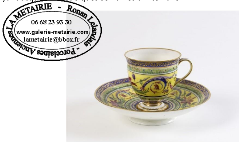
Tasse et soucoupe, fond jaune, de forme étrusque. Porcelaine tendre, vers 1793-1795.