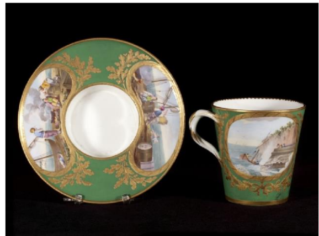
Buteux fils aîné (actif de 1763 à 1801). Tasse litron et soucoupe. Jean-Louis Morin. Tasse trembleuse et soucoupe. Porcelaine tendre, Porcelaine tendre, 1783. 1768.