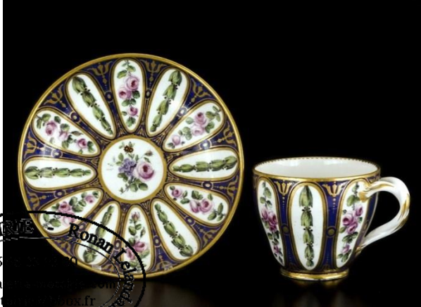
Bertrand. Gobelet Hébert et soucoupe. Porcelaine tendre, 1767

exemples de théières de forme ovale (celle du déjeuner solitaire peint par Vielliard , par exemple) et de gobelets dont la forme délicatement évasée vers le haut au départ devient droite un peu plus tard (comme celui de la collection Cognacq-Jay décoré par Pierre-Antoine Méreaud de trophées d'armes et d'instruments de musique). La forme Bouillard enfin est représentée par des tasses très simples, de forme ovoïde un peu trapue.