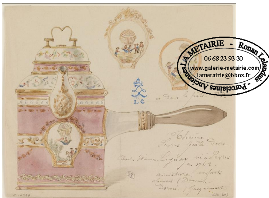
Étienne-Charles Leguay. Modèle d'une théière de Sèvres en pâte dure . Vers 1783. Encre brune, pierre noire et aquarelle.

La porcelaine tendre est très présente dans l'exposition et tout particulièrement la porcelaine tendre de la manufacture de Vincennes. Créée en 1740 pour concurrencer les porcelaines de Chine et de Saxe, la manufacture de Vincennes est officiellement protégée par le roi Louis XV en 1745 et débute une production originale, de style français, à partir de 1751. La manufacture conçoit alors des décors originaux, parmi lesquels le semis de fleurs au naturel, très répandu par la suite, et de nombreuses formes pour le service de boissons exotiques, dont les archives de la manufacture de Sèvres conservent plusieurs dessins souvent annotés et datés. Grâce à ces dessins, aux inventaires, registres de fournée ou encore registres de vente, le nom donné par la manufacture aux pièces qui composent ses déjeuners est souvent connu. Plusieurs formes, créées entre 1751 et 1755 en différentes grandeurs, connaissent un succès durable et sont reprises à Sèvres, après le déménagement de la manufacture en 1756. Meissen, en témoigne le cabaret à décor vert et rose (CSS), vers 1770, les a utilisées également.